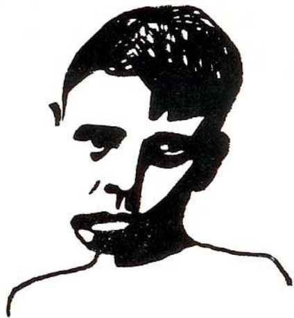
Leo DE HURLEVANT (d'après F. MISTRAL)E